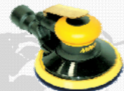
Exzenterschleifer mit extra großer Absauglocke