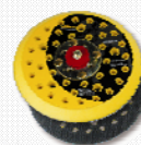
150 mm Multiloch-Schleifteller